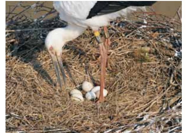
写真1 立ち上がり卵を転がす J0275

J0275(2000年生れ、オス)とJ0228(1998年生れ、メス)のペアの巣に伏せる時間が、2月11日から観察時間の50%以上と長くなりました。その後、時々立ち上がり卵を均等に温めるためにクチバシで転がす転卵行動のような様子が見られるようになり、産卵の可能性が出てきました。そこで、2月23日に高所作業車を使用して人工巣塔の巣内を観察したところ、6個の卵が確認されました(写真1)。