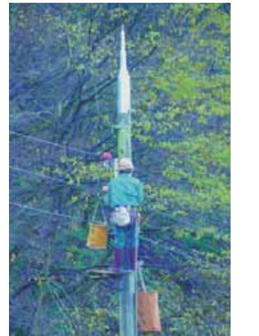
写真2 架線移設した電柱(12月2日撮影)

今年もまもなく繁殖期を迎えますが、電柱の上で営巣しないように、12月1日から関西電力(株)の協力を得て、既にあった巣材の撤去をしました。そして、巣材をかけられないように、電線を横並列から縦並列に変えました(写真2)。