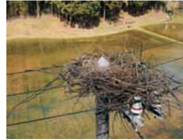
写真1 営巣された電柱(3月17日撮影)

昨シーズンは、豊岡市野上にあるコウノトリ保護増殖センター前の電柱上において、放鳥コウノトリのペアJ0001(2006年生れ、オス)とJ0362(2003年生れ、メス)が、営巣を始めるようになりましたが(写真1)、コウノトリにも人間にも電柱での営巣は危険なことなので、関西電力(株)の協力を得て何回か巣材撤去(注1)を行いました。