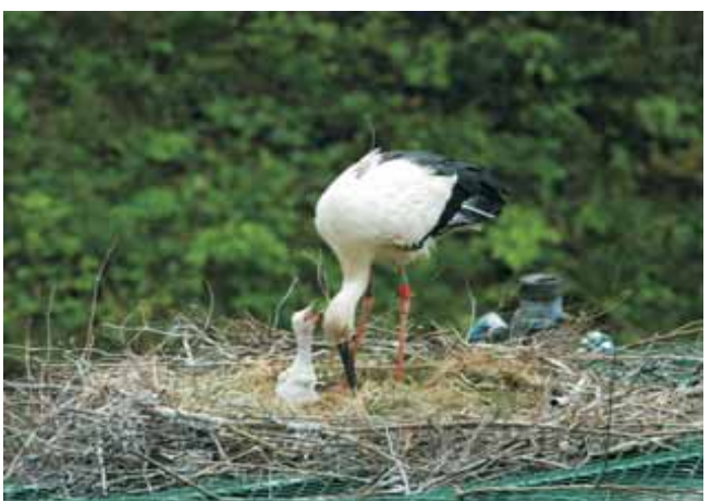
写真1 ヒナと J0362 (5月13日撮影)

放鳥コウノトリ J0362(2003年生れ、メス)と J0001(2006年生れ、オス)のペアが、豊岡市野上にあるコウノトリ保護増殖センターの第4ケージ屋根の上に巣を作り産卵していました。そして、5月1日に1羽のヒナが孵化していることを確認しました(写真1)。今年の繁殖期における野外でのヒナの孵化は、4月28日豊岡市城崎町戸島地区の人工巣塔で孵化した3羽に引き続き4例目となります。ところで、今回の