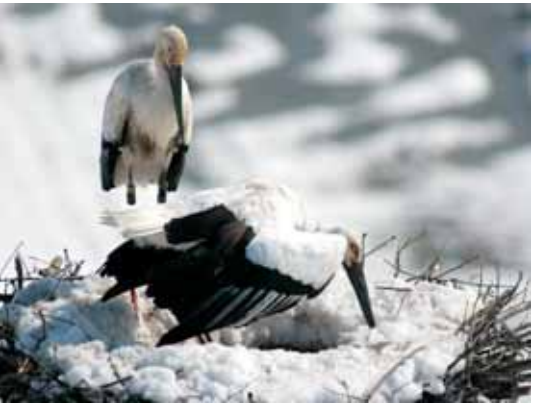
写真2 J0228と交代するために立ち上がる J0275