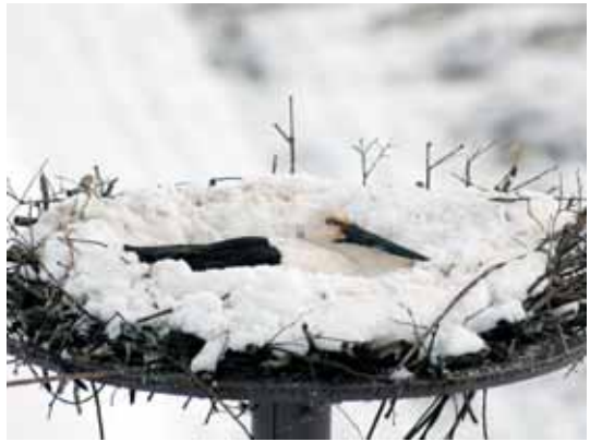
写真1 百合地地区の人工巣塔に伏せる J0275

降ろうと巣で伏せ続ける親鳥にはつらいかもしれませんが、悪天候や卵を狙うカラスなどに負けず、頑張っ温め続けてほしいと思います。