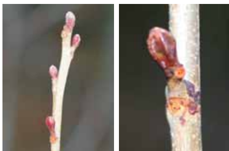
ハンノキの芽：赤く少しふくらんでいるのが冬芽で、その下の“顔”に見えるのが葉のついていた跡

木の種類によって、“顔”の形や“自鼻立ち”も違いますし、顔がなく“口”だけに見えるものもあります。皆さんも、身近にある木のオモシロイ顔を探してみませんか？