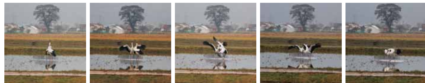
写真1-5 J0003(奥)がJ0228(手前)に刃向かうようす

まるで人の子の反抗期を思い起こさせるような行動でしたが、J0228はさして気に留める風でもなく、直後の反応も落ち着いていました。注1:上下のくちばしをカスタンネットのように打ちあわせ、カタカタと音を出すこと。愛情表現や威嚇などのコミュニケーション。