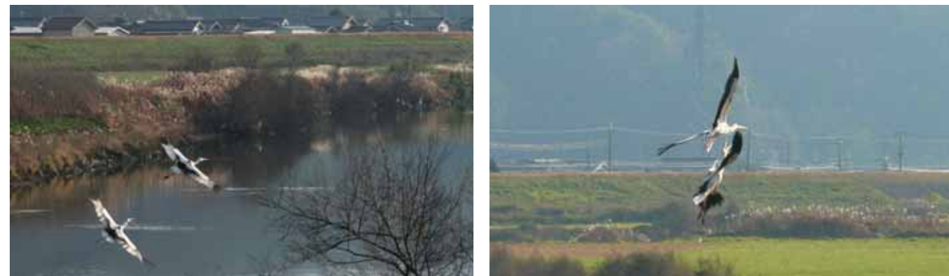
写真6・7 J0391を追いかけるJ0381

いきもの通信No.123・124でもお伝えしてきたJ0381によるJ0391への嫌がらせはまだ続いており、J0391が近くへ寄り過ぎると追いかけ、追い払っています。今回はただ追いかけるだけでなく、飛びながらクラッタリングまでしていました。この2枚の写真、よく見ると後ろのコウノトリの口が開いているのですが、おわかりですか?