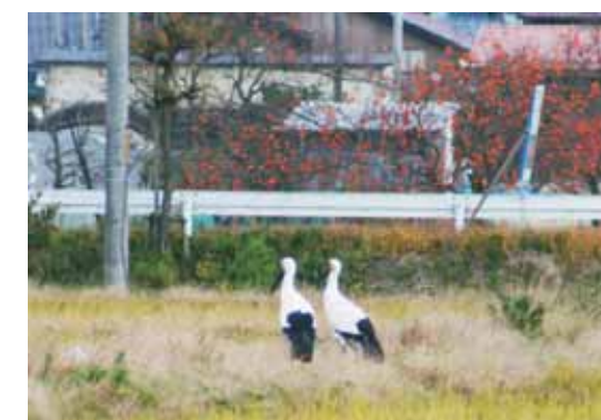
写真1 エサを探す合間にたたずむ J0228 と J0275

先月号でもお伝えしたように、J0381(2004年生れ、オス)はJ0391(2004年生れ、オス)のことを快く思っていないのか、近くに居合わせると執拗に追い払おうとしますし、J0290(2000年生れ、オス)はJ0405(2006年生れ、オス)や他のオスのコウノトリに向かって威嚇します。来年の繁殖期に向けて、こういったオス同士の小競り合いは、これからも多く見られるようになるかもしれません。コウノトリの繁殖は年に一回、そのための巣づくりは通常1月ごろから始まります。ちなみに、野外で来年繁殖活動を行う可能性が高いのは、次のコウノトリたちです。