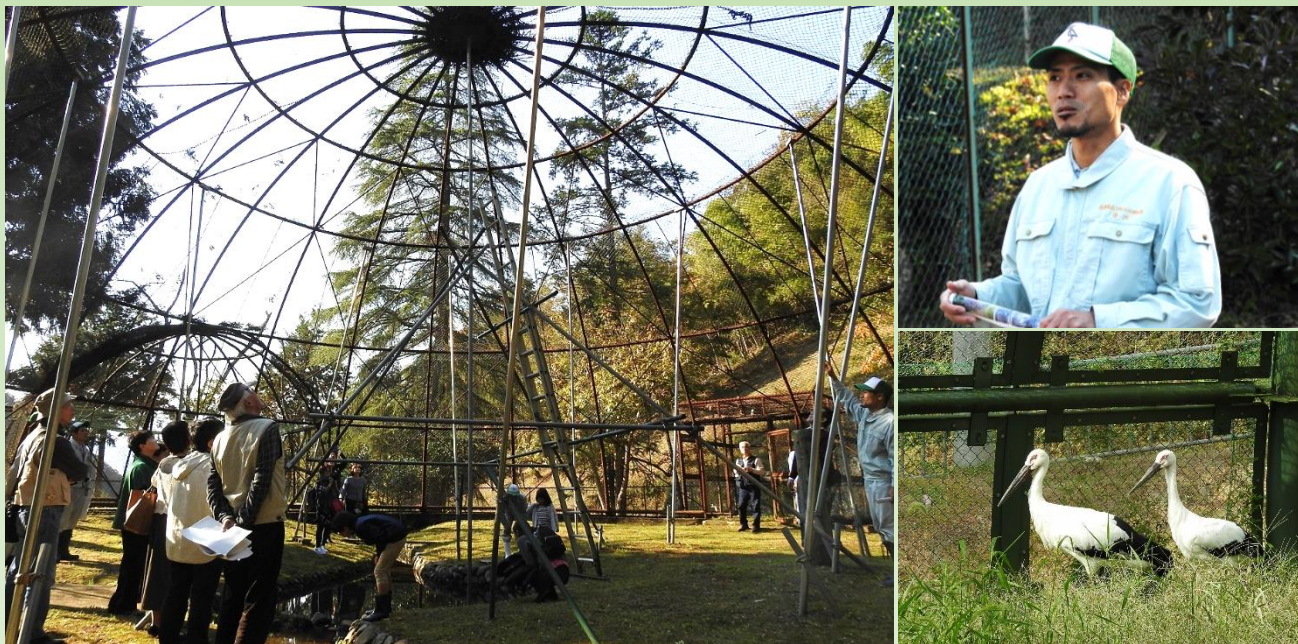
写真左：1965年野生コウノトリを初めて収容した第1ケージ(通称：約束のケージ)の現在の姿 右上：飼育員による解説 右下：飼育コウノトリのうち最高齢の「Bペア」

・ふだんは入場することのできない「コウノトリ保護増殖センター」のなかを、飼育員による解説つきで見学できます。 ・コウノトリ保護増殖の歴史の象徴でもある「約束のケージ」や、その他たくさんのケージでくらすコウノトリの様子を見ることができます。